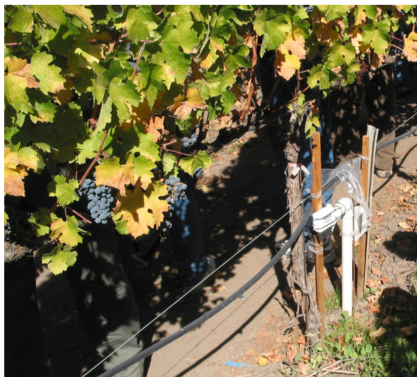
Riego de parras con tubería de goteo.